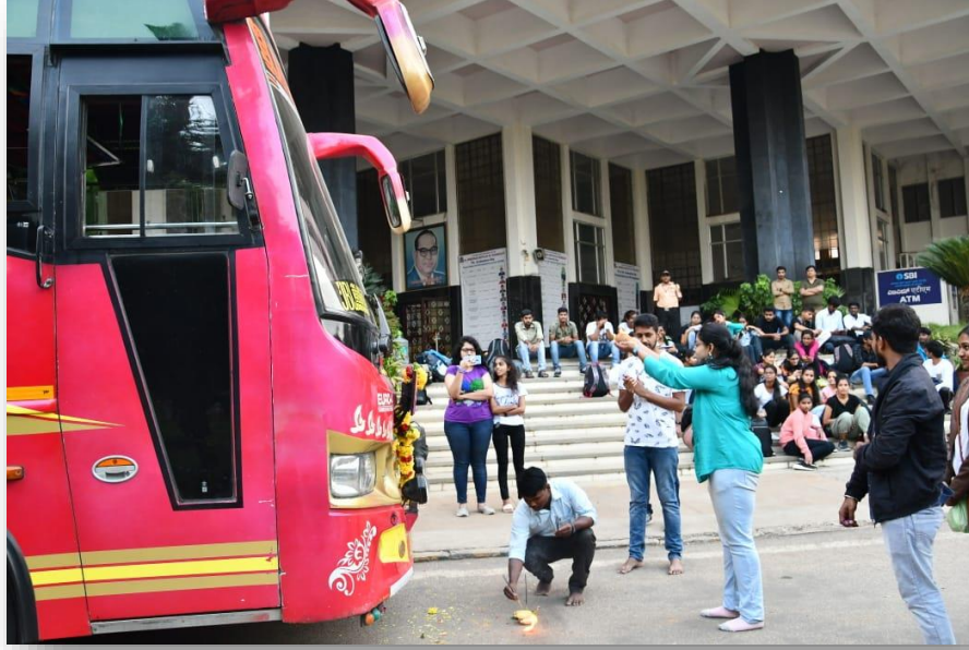
ಬಸ್ಸಿಗೆ ಪೂಜೆ ಮಾಡುತ್ತಿರುವ ದೃಶ್ಯ