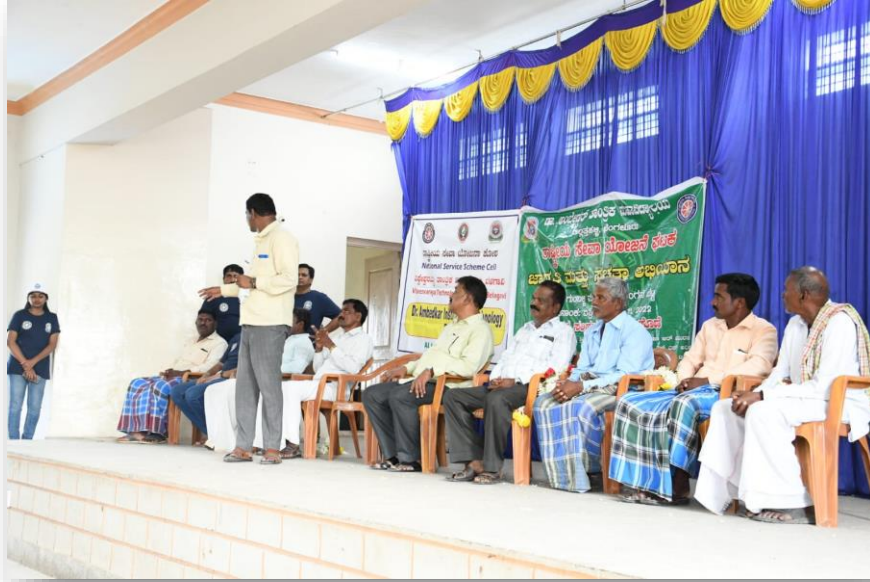
ಮಾಜಿ ಜಿಲ್ಲಾ ಪಂಚಾಯತ್ ಸದಸ್ಯರಿಂದ ಸಭೆಯನ್ನು ಉದ್ದೇಶಿಸಿ ಭಾಷಣ