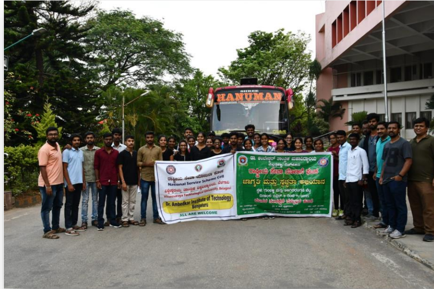
ಬಿಳಿಗಿರಿರಂಗನ ಬೆಟ್ಟಕ್ಕೆ ಹೊರಡಲು ಸಿದ್ಧವಾಗಿರುವ ತಂಡ